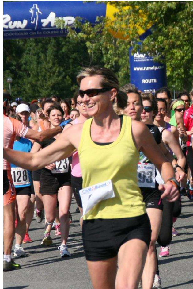
■ Dans de nombreuses épreuves, les féminines étaient en nombre, Comme ici au Lacathlon